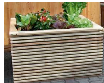
Typ LIGNUM aus Latten 26/45 Andere Querschnitte möglich! Sichtseite = 26 mm € 193,00 / Umlaufmeter *