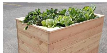
Typ FUMANA 26 aus Brettern 26/145 (Höhe = ca. 0,77 m) Andere Querschnitte möglich! € 135,00 / Umlaufmeter * oder