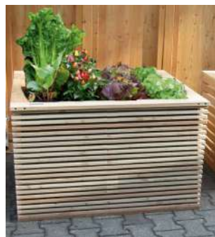
Typ BEGONIA aus Latten 20/30 Andere Querschnitte möglich! Sichtseite = 20 mm € 199,00 / Umlaufmeter *