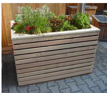
Typ STRATUM aus Latten 26/60 gerade Andere Querschnitte möglich! Sichtseite = ca. 60 mm € 178,00 / Umlaufmeter *