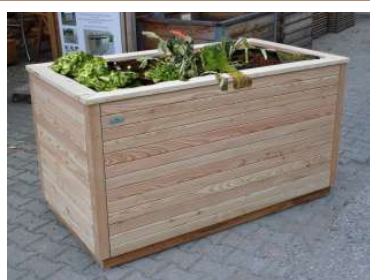
Typ RUBRA aus Rhombus Fassaden-Latten 26/60 Sichtseite = ca. 53 mm € 199,00 / Umlaufmeter *